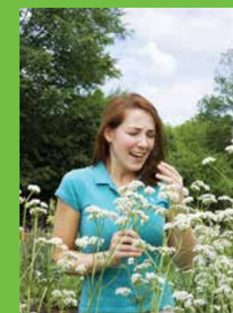
Damit haben viele Bundesbürger schon leidvolle Erfahrungen gemacht: Die Pollenallergie wird im Volksmund auch als Heuschnupfen bezeichnet. (djd/pt). Foto: djd/Ergo Direkt Versicherungen/thx

„Heuschupfenzeit“: Nach Erle und Haselnuss tanzt im April der Blütenstaub von Birke und Esche durch die Luft. Mai und Juni ist die Zeit der Gräserpollen, gefolgt von der Beifußsaison im Hochsommer.