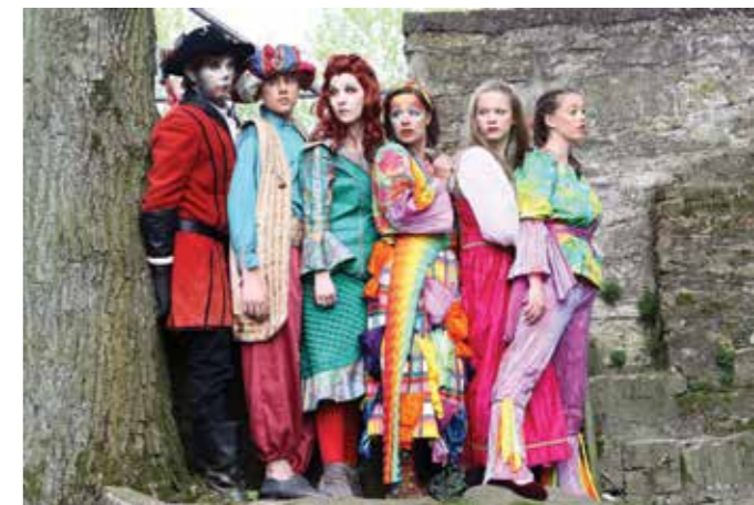
„Märchenpolizei“ hieß es im Vorjahr, in diesem Jahr kommt „Simba“ auf die Freilichtbühne Stromberg.

Lippetal heißt die Radler zur Eröffnung der Fahrradrouten am 30. April bei Kilometer 110 willkommen: Wasserschlösser, Wallfahrt, Pöttkes und unberührte Natur präsentiert sich hier. Außerdem bietet sich die Gelegenheit, die Wassererlebnis-Schleife aus dem Projekt „Naturerlebnis Auenland“ kennenzulernen.