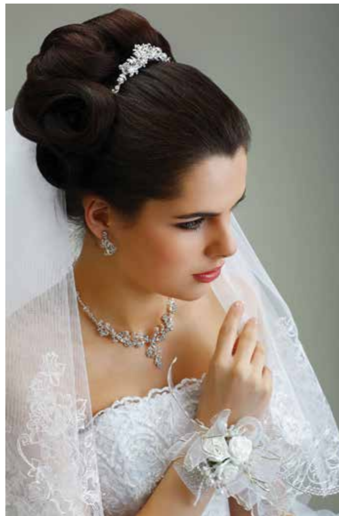
Am schönsten Tag des Lebens sollte auch die Frisur perfekt sein.

Eine auf den Hauttyp abgestimmte Pflege und ein- bis zweimal wöchentlich aufgetragene Spezialmasken sorgen für eine geschmeidige und glattere Haut. Auch die Haare benötigen rechtzeitig Aufmerksamkeit. Gepflegte und gesunde Haare sind eine wichtige Voraussetzung dafür, dass es mit der Brautfrisur auch wirklich klappt. Leider steht es mit der Haarpracht vor der Hochzeit nicht immer zum Besten. Pflegerituale kommen in der hektischen Vorbereitungszeit mitunter zu kurz und auch der Stress selbst lässt Bräuten im wahren Sinn des Wortes die Haare zu Berge stehen. Ist noch etwas Zeit bis zum großen Tag, dann sollte man den