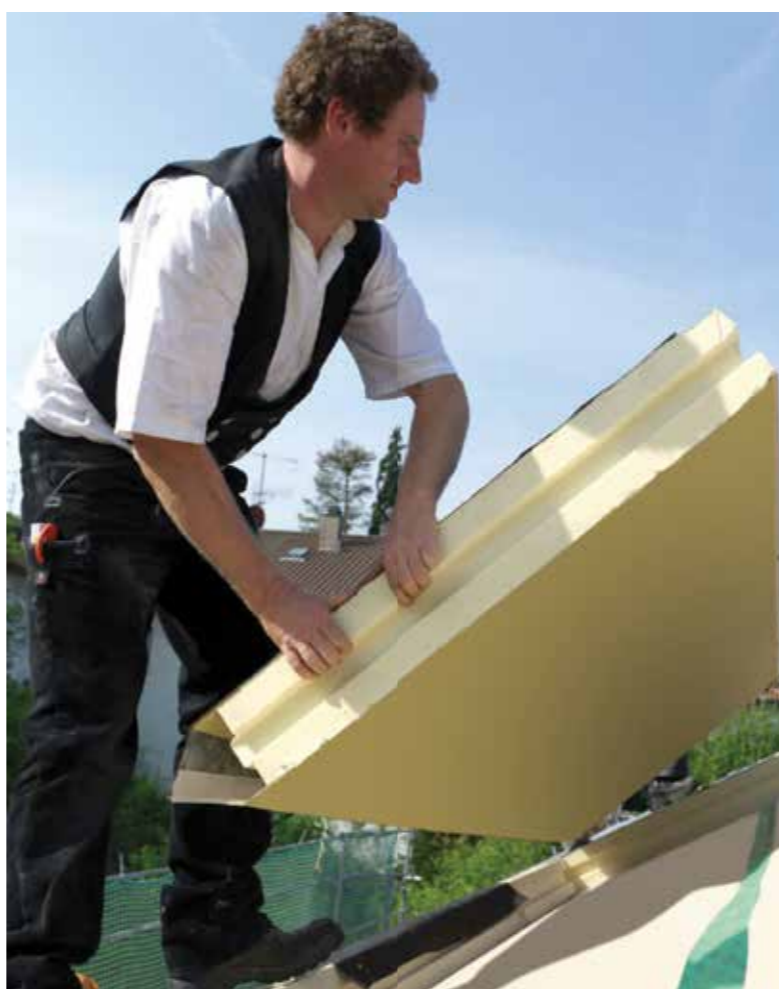
Die Dämmung des Dachs gehört in fachmännische Hände. Auf die Sparren verlegt, hüllt eine Dämmung die Dachkonstruktion lückenlos ein.

Gerade das Dach ist oft eine Schwachstelle, die dringend isoliert werden müsste. Wer jetzt eine energetische Sanierung plant, sollte beim Dach anfangen - immerhin ist es für rund ein Drittel der Energieverluste verantwortlich. Dachfenster in hoher energetischer Qualität und mit Verschattungsmöglichkeit sowie eine rundum dichte und lückenlose Dämmung sind unerlässlich, wenn der Heizenergieverbrauch sinken und die Wohnbehaglichkeit im obersten Geschoss steigen soll.