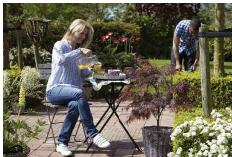
Draußen ist es in der warmen Jahreszeit meist am schönsten. Einige genießen dann ganz entspannt auf der Terrasse die freie Zeit, andere werden lieber im Garten aktiv.

Andere sind lieber aktiv und erholen sich beim Schneiden oder Jäten und umgeben von den Pflanzen. Oft liegt der Unterschied einfach nur an der verfügbaren Zeit. Wenn Zeit knapp ist, kann man den Garten von einem Fachmann so anlegen oder umgestalten lassen, dass möglichst wenig Pflegearbeiten anfallen oder man überlässt aufwändige Tätigkeiten wie den Formschnitt bei Hecken einem Landschaftsgärtner.