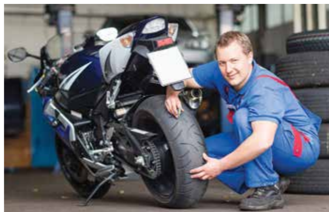
Boxenstopp vor dem Start in die neue Motorrad-Saison: Reifen, Bremsen und Licht sollten jetzt überprüft werden.

Motorradfahrer und Cabriofahrer können es kaum erwarten. Sie wollen endlich wieder auf die Piste und sich den Fahrtwind um die Nase wehen lassen. Bevor die neue Saison aber losgehen kann, sollten die Fahrzeuge gründlich überprüft werden. Motorradfahrer sollten ihre Maschine zunächst gründlich checken, bevor es wieder auf die Piste geht.